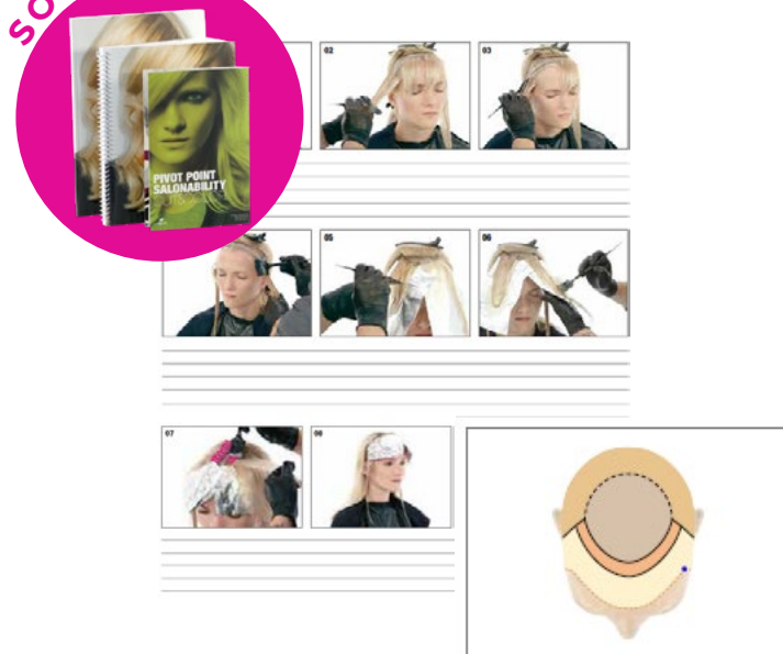
Cut & Color // p.34-35