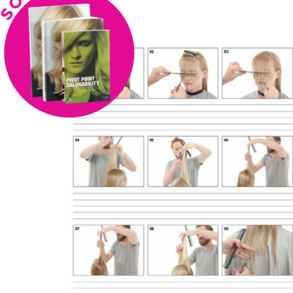
Cut & Color // p.30 à 33