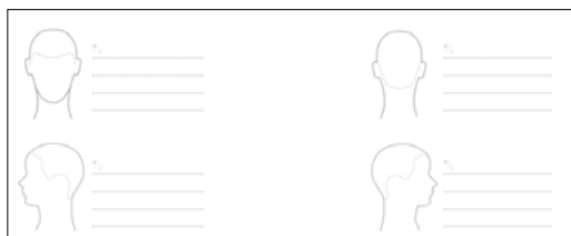
Feuille de gabarit vierge